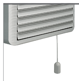
Versione con apertura manuale (interruttore a corda)