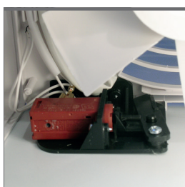
Termoattuatore per l'apertura elettrica delle alette