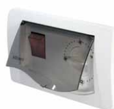
Regolatore di velocità elettronico R15