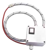
Morsetteria esterna con interruttore di servizio