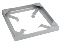
Controbase a murare