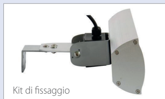
Kit di fissaggio