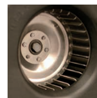
Girante centrifuga ad alta efficienza in alluminio.