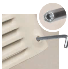
Sistema di viteria antivandalo.