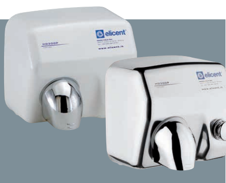
HD300P - Manuale HD300PX - Manuale Cromato

Consumi ottimizzati: l'apparecchio si spegne immediatamente a fine utilizzo.