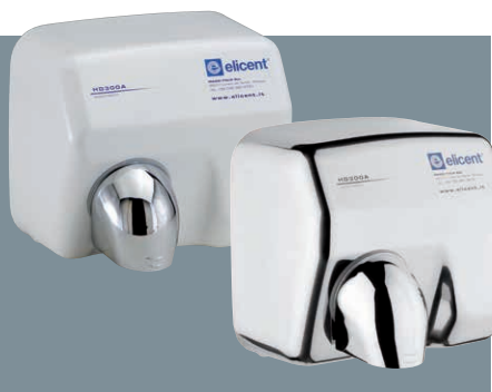
HD300A - Automatico HD300AX - Automatico Cromato