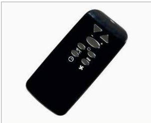
Telecomando in dotazione